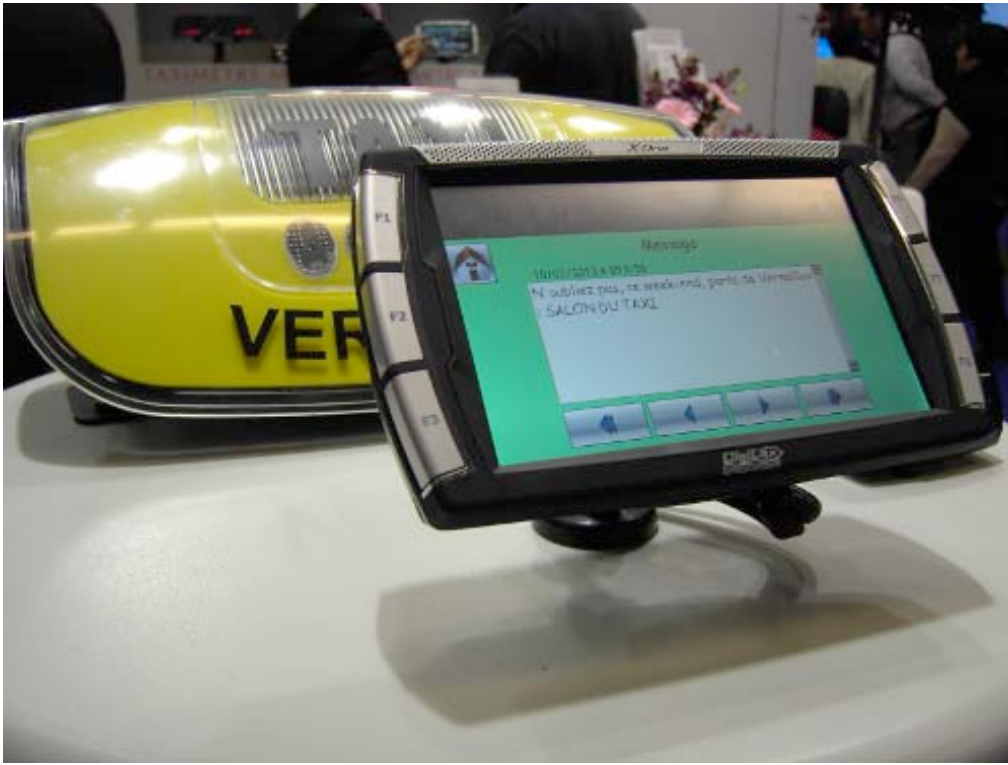
Le terminal d'AXYGEST: navigation, facturation, télétransmission ...

On peut citer le Primus Mirror de la société ATA, qui présente aussi son système de vidéo-protection enregistrant l'habitacle du véhicule, des produits de belle qualité fabriqués en France. J'aurai l'occasion de vous parler plus en détail de ce qui se fait de nouveau dans l'équipement matériel dans de prochains articles