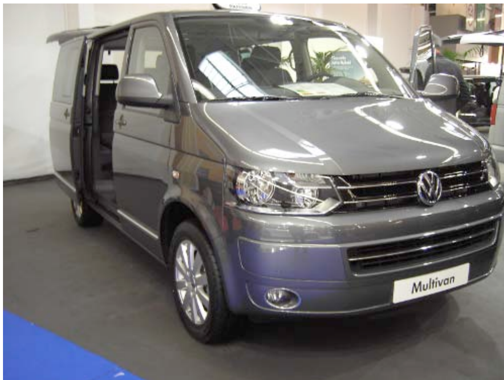
Le Multivan du constructeur VOLKSWAGEN

Parmi les organismes de financement, d'achat et revente, mutuelle et assurance, éditeurs de presse, autorité administrative, on a pu voir aussi certains centres de formation comme l' institut du Regard Persan , l' Ecole de Taxis de Paris Ile de France , i2Ft basée à la Cité taxi et qui propose une formation complète avec la souplesse du elearning et l' ECFT du groupe Gescop .